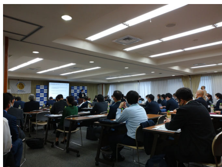
10月10日 オータムフォーラム

県協会の活動紹介、研究会の活動紹介、講演、プロコン養成塾・ステップアップ研修の紹介、実務従事紹介、新人ベテラン交流会などの内容でした。