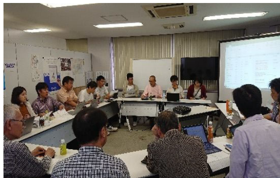
実行委員の活動(コロナ禍前)

フレッシュフォーラム・オータムフォーラムは新たに県協会に入会された方を中心に実行委員として企画運営を行っています。2020年度はコロナ禍により活動に制約がでしたが、企画・運営を担っていただいています。新たにご入会される方は県協会に慣れていただくためにも是非参画をお願いします。