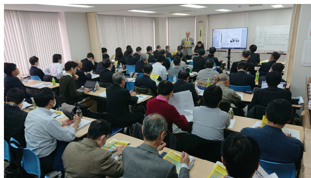
毎月の定例研修交流会の様子

会員が中小企業支援等に関するテーマについて、スキル向上及び仕事機会創出の場として研究会を立ち上げ活動することを支援します。