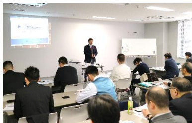
講座風景 イメージ

本講座では、経営戦略シートをベースにしてサブシートとともにコンサルティング現場での使い方を学びます。