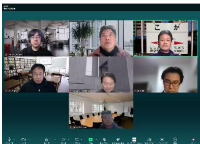
メンバーによるミーティングの様子

当研究会では、令和7年度調査・研究事業の実施について全研究会員で取り組みました。